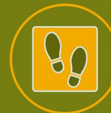
DESINFECCIÓN DE SUELAS DE ZAPATOS