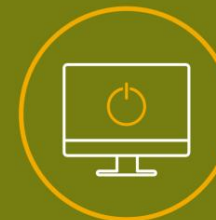
LUCES Y ORDENADORES, APAGADOS