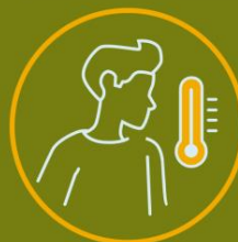
TOMA DE TEMPERATURA