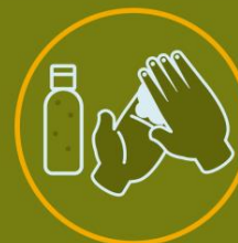
DESINFECCIÓN DE MANOS CON GEL HIDROALCOHÓLICO