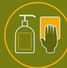
ZONA DE TRABAJO DEL PROFESOR, DESINFECTADA