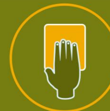
ASEGURA LA LIMPIEZA DE TU ZONA